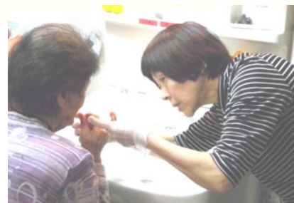
医師による口腔ケア

定員：2ユニット（24名） 営業時間：9:00～18:00 送迎：西東京市内 西武池袋線以南