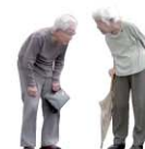
ドキュメンタリー映画