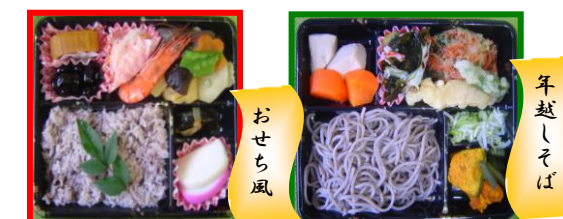
年末年始の夕食のお弁当