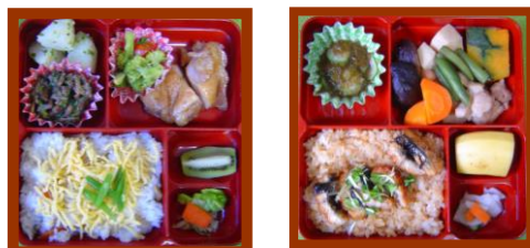
ひなまつり ちらし寿司のお弁当